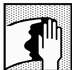
Dynacoat Degreaser Vandbaseret

Produktnavn: Dynacoat Degreaser vandbaseret