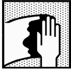
Dynacoat Degreaser Vandbaseret