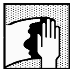
Dynacoat Uni Silikonfjerner