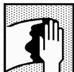
Dynacoat Uni Degreaser